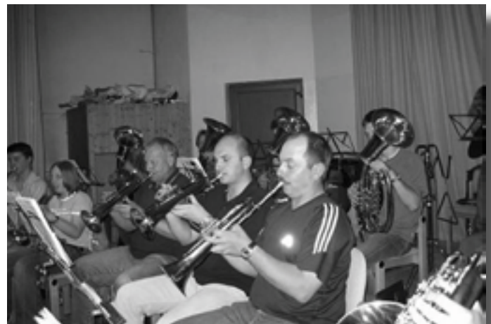
Probenarbeit vor dem Konzert