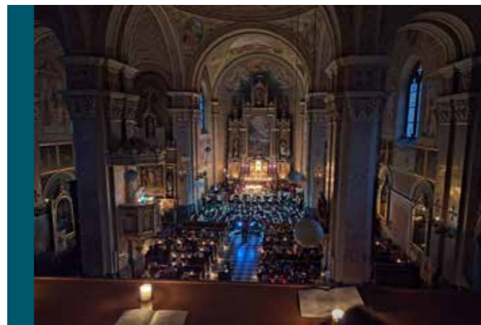
Mit einem ganz besonderen Kirchenkonzert begann der Festreigen zum 225-Jahr-Jubiläum der MK Silz

Das Jahr 2025 steht ganz im Zeichen des Jubiläums. Wenn sich auch durch den Neubau des Probelokals einige Dinge verschoben haben. Kein Frühjahrskonzert, aber dafür ein ganz besonderes Kirchenkonzert im April – so hat unser Jubiläumsjahr begonnen.