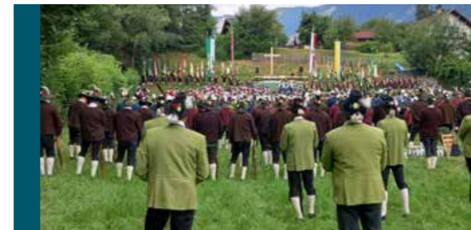
Zahlreiche Schützenkompanien bei der Feldmesse.