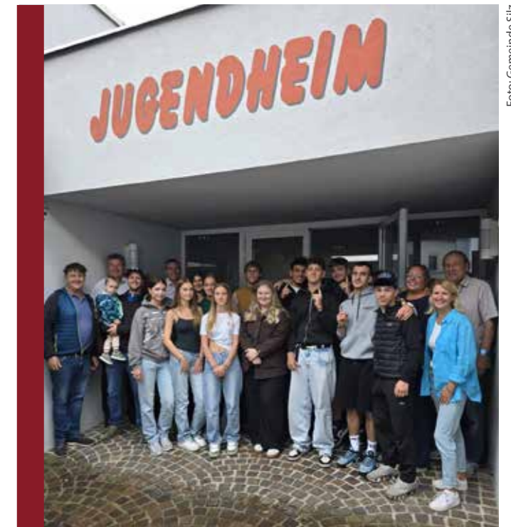
Das einjährige Jubiläum des Jugendzentrums Silz-Mötz wurde mit einem Grillfest in kleinem Rahmen gefeiert.