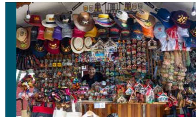
Ein klassischer Souvenirstand in Pozuzo