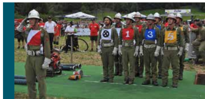
Gruppe Silz 1

Am Nachmittag gingen auch die Silzer Bewerbungsgruppen vor heimischem Publikum an den Start. Silz 3 eröffnete den Bewerb für die Gastgeber und erreichte mit einer Zeit von 66,52 Sekunden und 20 Fehlerpunkten den 15. Platz. Silz 2 überzeugte mit einem fehlerfreien Lauf in 56,24 Sekunden und belegte damit einen hervorragenden fünften Rang. Den Höhepunkt des Silzer Auftritts setzte Silz 1 mit einer fehlerfreien Zeit von 52,64 Sekunden – eine der stärksten Leistungen des gesamten Tages. Beide Gruppen qualifizierten sich damit für den anschließenden K.O.-Bewerb der besten acht Gruppen des Bezirks.