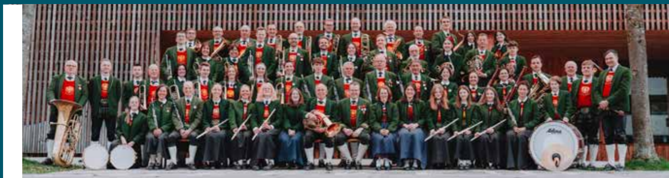
Die Musikant:innen der MK Silz freuen sich auf die Fertigstellung des neuen Probelokals. Die Eröffnung folgt im Herbst 2025.