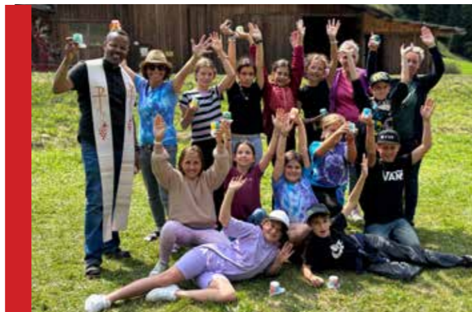
Bild oben: Die gesammelten Ministrant:innen aus allen Pfarren sowie das Betreuer-Team.