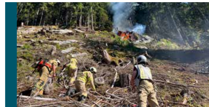
Waldbrand in Silz