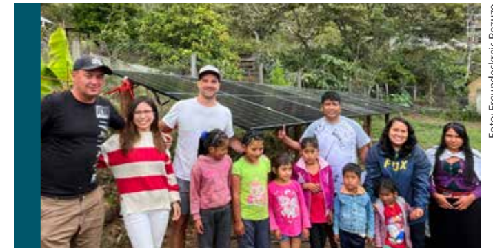
Endlich gibt es im Weiler San Luis dank der neuen Photovoltaikanlage Strom für die dortige Schule