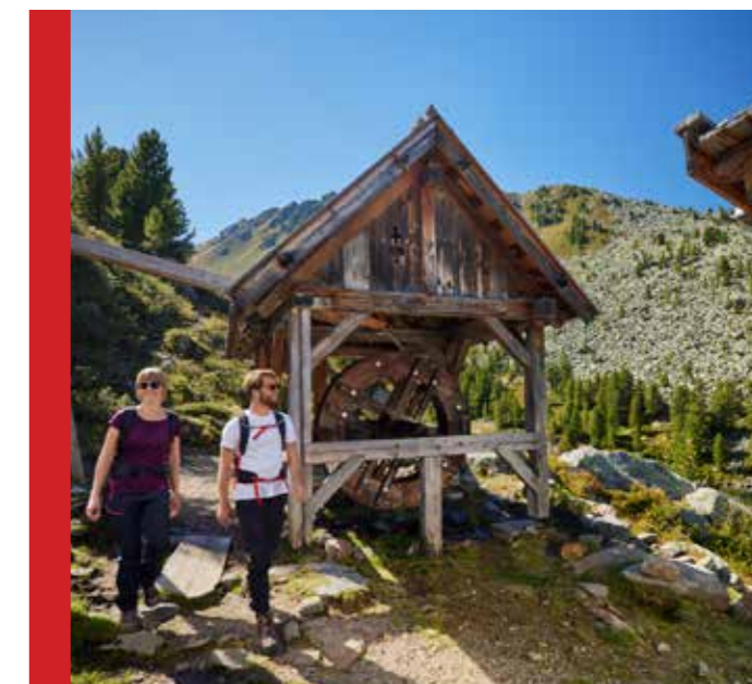
Der Knappenweg zwischen Hochoetz und Kühtai wurde vor 20 Jahren eröffnet. Zentrum ist das Knappenhaus, bei dem am 14. September das Jubiläum auch gefeiert wird.

Die Tourismusverbände und Bergbahnen Kühtai