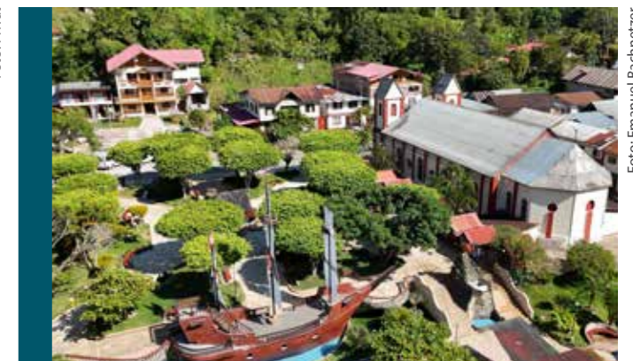
Blick auf den Park Pozuzos