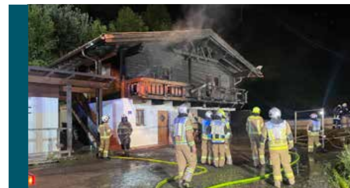
Gebäudebrand in Sams