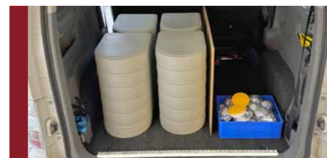
Das Essen auf Rädern wird in solchen Warmhalteboxen verlässlich und pünktlich ausgeliefert.

Als Dankeschön für ihren Einsatz als Fahrer:innen unseres E-Autos ELSi, unter anderem auch für das verlässliche Ausliefern von "Essen auf Rädern", lud Bürgermeister Helmut Dablander kürzlich die ehrenamtlichen Fahrer:innen zu einer kleinen feinen Grillfeier ein. Das gemütliche Beisammensein fand mit der Möglichkeit zum Luftgewehrschießen im k.u.k. Schießstand seinen Abschluss.