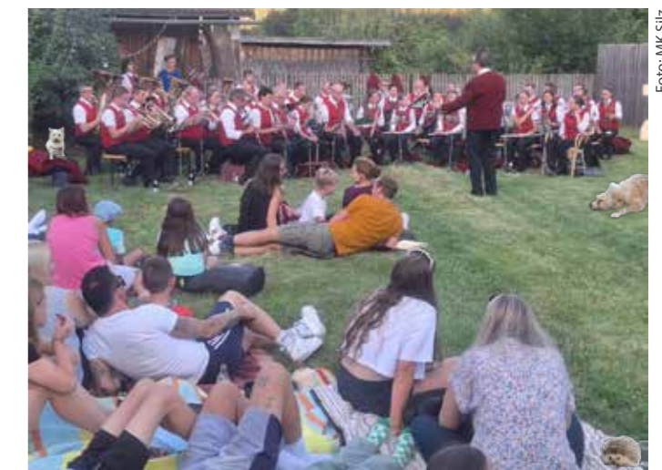
Beim rechten Bild des Picknick-Konzerts der Musikkapelle Silz haben sich ein paar Fehler und ungewöhnliche Gäste eingeschlichen.