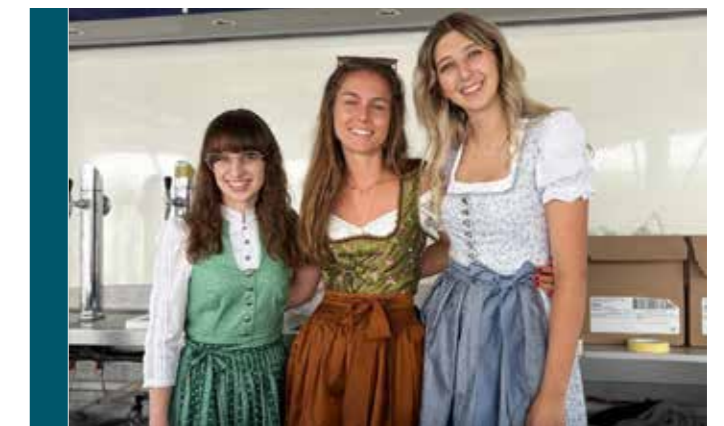
Reger Besuch herrschte an der Marketenderinnen-Pfiffbar.