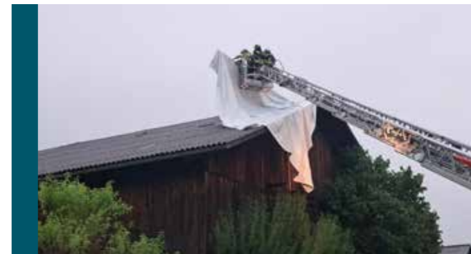
Einsatz nach Unwetter in Sams.