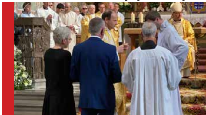
Das Anlegen des Priestergewandes, überreicht von den Eltern, ist Teil der Weihehandlung.