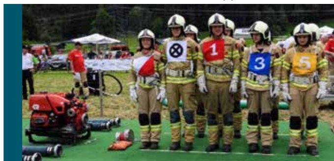
Gruppe Silz 3

Tarrenz geschlagen geben. Für Silz 2 war im Halbfinale gegen Tarrenz ebenfalls Endstation. Den Gesamtsieg im K.O.-Bewerb sicherte sich schließlich die Gruppe Tarrenz 2.