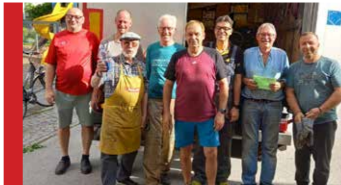
Viele helfende Hände ermöglichten wieder eine erfolgreiche Kleidersammlung der Kolpingfamilie für Rumänien.