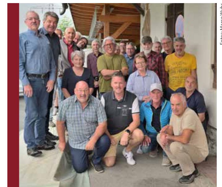
Die ehrenamtlichen Fahrer:innen von ELSi und Essen auf Rädern wurden als Dankeschön zu einer Grillfeier eingeladen.