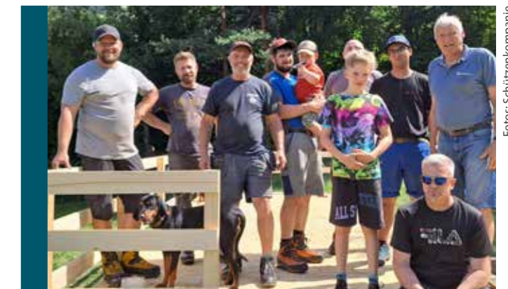
Dank der tatkräftigen Unterstützung zahlreicher Helfer:innen wurde das Bezirks- und Bataillonsschützenfest zu einem großen Erfolg.