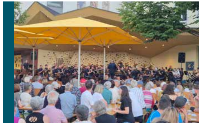
Das Gastkonzert der Polizeimusik Tirol am Josef-Tiefenthaler-Platz war eines der musikalischen Highlights im heurigen Konzertsommer der Musikkapelle Silz.