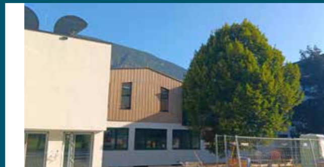
Außenansicht des neuen Probelokals - Südseite