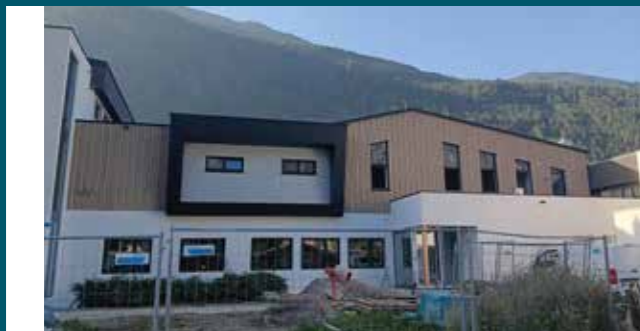
Außenansicht des neuen Probelokals - Nordseite