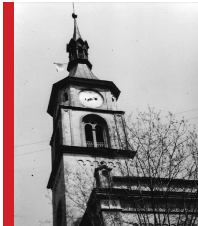
Am Kirchturm hängt die weiße Fahne.