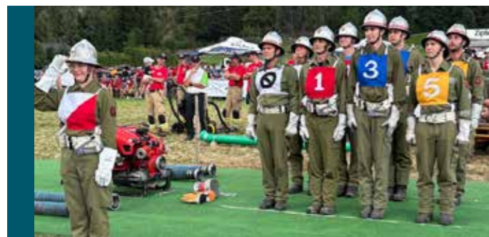
Gruppe Silz 2

Im K.O.-Bewerb kam es zu spannenden Duellen. Silz 2 setzte sich in der ersten Runde gegen Wenns durch und zog souverän ins Halbfinale ein. Silz 1 musste sich im Viertelfinale in einem äußerst knappen Lauf der starken Gruppe aus