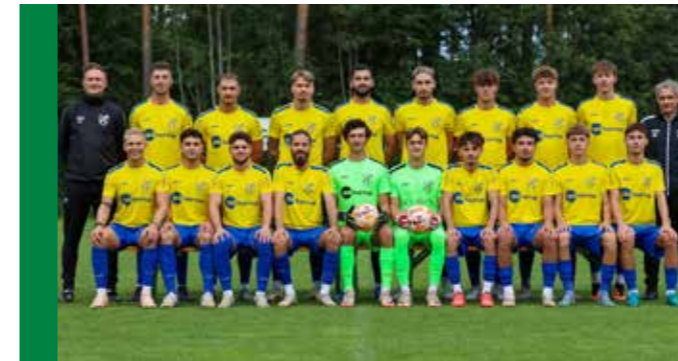
Die Kampfmannschaft I der SPG Silz/Mötz

Unser „Aushängeschild“, die Kampfmannschaft I spielt wiederum in der höchsten Tiroler Spielklasse und versucht dort erfolgreich zu sein, um weiterhin die zweitstärkste Mannschaft im Oberland zu sein.