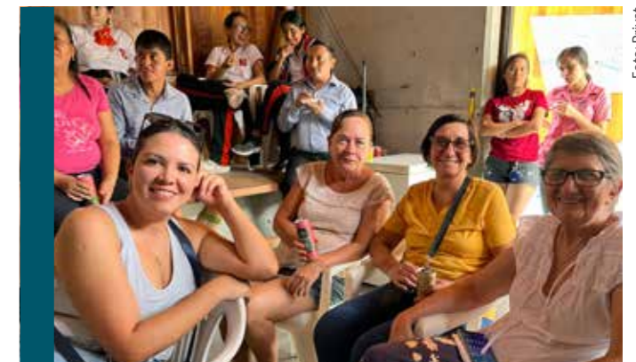
Viele Zuseher auch in Pozuzo, beim Livekonzert der MK Silz