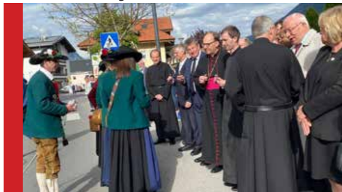
Begrüßung und Empfang durch die Vereine nach der Weihe.