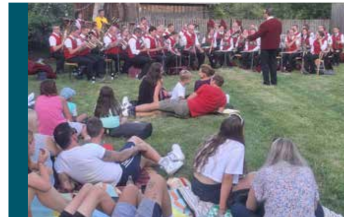
Zum Picknickkonzert im Garten der Familie Bachnetzer kamen zahlreiche Besucher:innen.

Jetzt, im Herbst sind zwei Punkte für die Musikkapelle besonders erfreulich. Am 15. November wird statt dem Frühjahrskonzert ein eigenes Herbstkonzert gespielt.