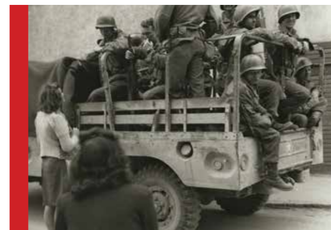
Einige Bilder aus der Zeit der Alliierten in Silz.